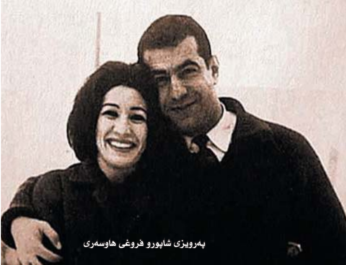
پهرویزی شاپورو فروغی هاوسه‌ری